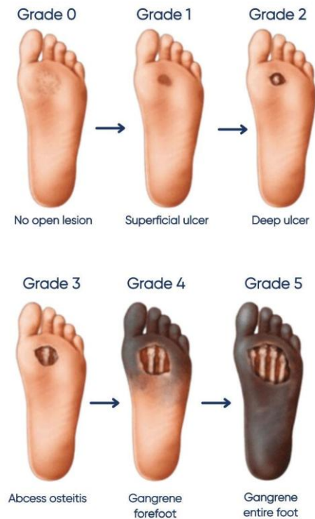
Gambar 1. Tahapan Kerusakan Kaki Diabetik Akibat Gangguan Pembuluh Darah. 15

Neuropati akibat diabetes menghilangkan sensasi protektif di kaki, sehingga cedera ringan sering tidak disadari dan dapat berkembang menjadi ulkus. Gangguan aliran darah akibat penyakit arteri perifer menyebabkan penurunan perfusi jaringan, yang berdampak pada lambatnya penyembuhan luka dan meningkatkan kemungkinan terjadinya nekrosis. Selain itu, infeksi oleh patogen seperti Staphylococcus aureus dan Pseudomonas aeruginosa memperparah kerusakan jaringan melalui pembentukan biofilm, yang melindungi mikroorganisme dari respons imun tubuh dan pengobatan antibiotik. Sinergi dari ketiga faktor ini memainkan peran penting dalam munculnya ulkus diabetikum yang kronis dan meningkatkan risiko amputasi ekstremitas bawah.